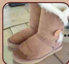
ムートンブーツのシミ抜きクリーニング