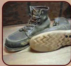
全体カラーリングとオールソール