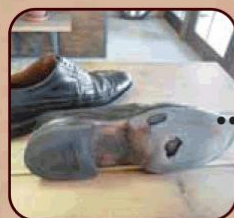
レザーからラバーへのソール交換