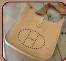
全体カラーリングと持手交換