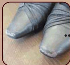
つま先のキズスレ補修