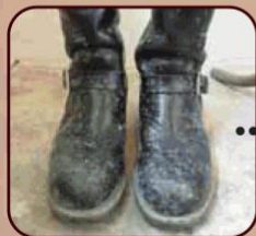
ブーツのカビ除去クリーニング