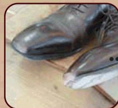
つま先のスレ補修とつま先ラバー補修