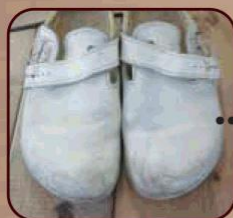
全体カラーリング